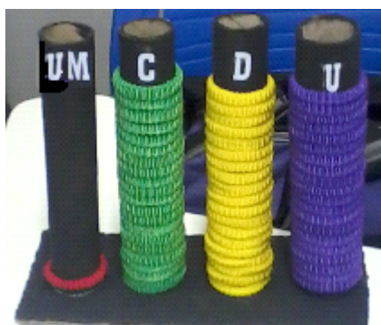
Figura 1 – Ábaco construído pela aluna A1

As alunas construíram ábacos verticais com materiais de baixo custo para utilização nas atividades. Os ábacos foram compostos por um pedaço de papelão como base, tubos de papelão, elásticos coloridos representando argolas (Figura 1).